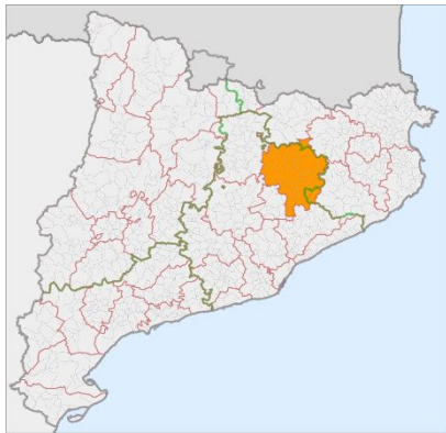
Figures 1 i 2: Mapes comarca d'Osona